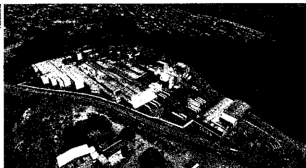
A unidade da BRF de Francisco Beltrão, no Bairro Pinheirinho, Cidade Norte.