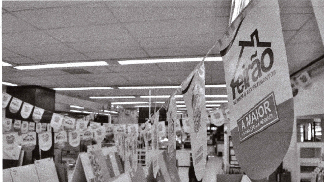
Quase todos os setores do comércio conseguiram retomar o fluxo positivo de vendas.

Da assessoria - Dados parciais da Pesquisa Conjuntural da Federação do Comércio de Bens, Serviços e Turismo do Paraná (Fecomércio PR) mostram que 2021 será o ano de retomada do varejo paranaense. No acumulado até outubro, o comércio paranaense obteve crescimento de 9,89%, com alta em praticamente todos os setores. Os ramos com vendas mais intensas foram óticas, cine-foto-som (20,73%), calçados (20,16%), materiais de construção (19,68%), vestuário e tecidos (16,57%) e atoupeças (16,12%).