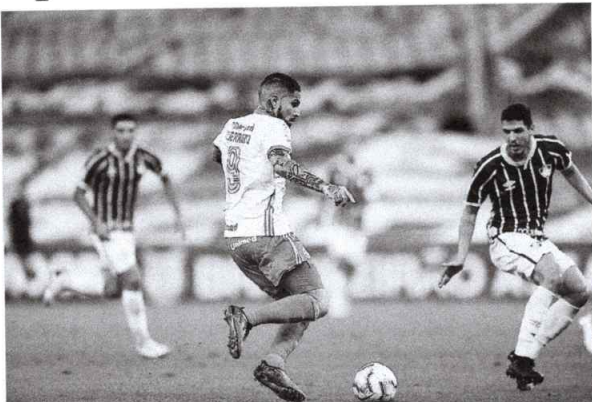
Guerrero tem 56 jogos e 30 gols pelo Inter.

O desempenho no Colorado é, também, o melhor do centroavante por um time brasileiro. Ele atua no Brasil desde 2012, quando trocou o Hamburgo (Alemanha) pelo Corinthians. No Ti-