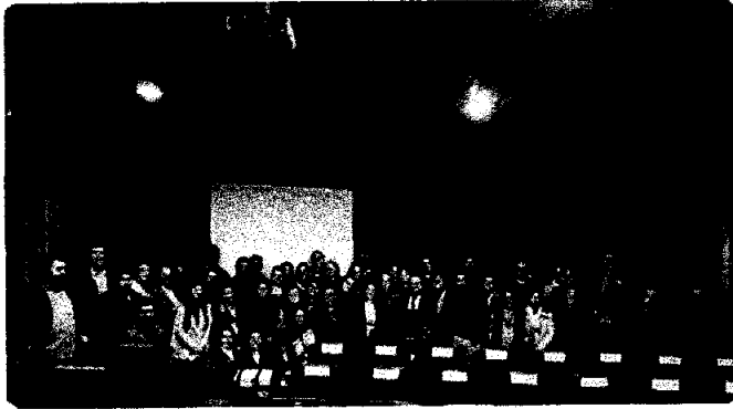
Primeira oficina concluída com sucesso